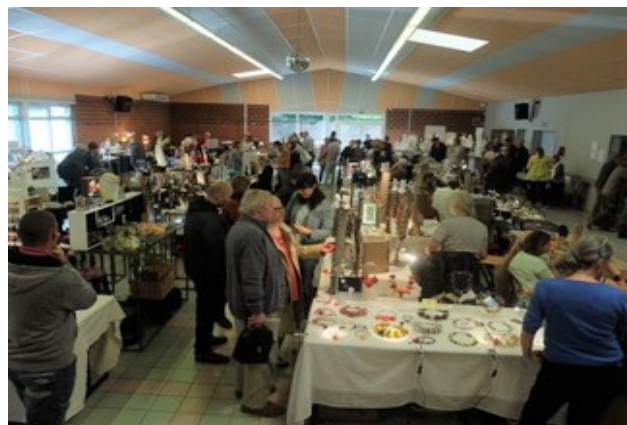
Journées du Verre et de la Perle 2017